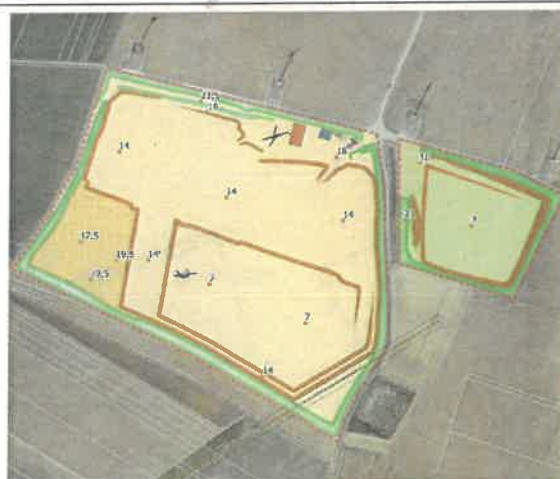
PHASE 4 (15-20 ans) : 2029 - 2033