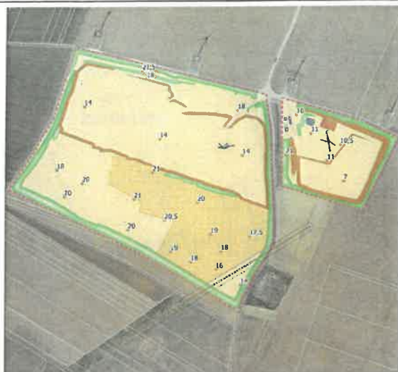
PHASE 2 (5-10 ans) : 2019 - 2023