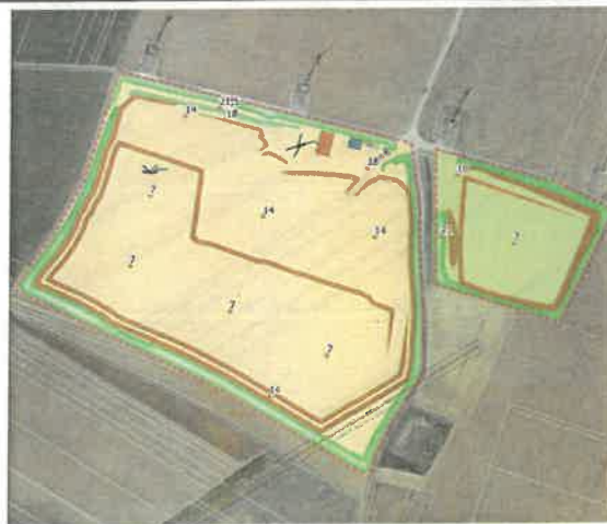
PHASE 5 (20-25 ans) : 2034 - 2038