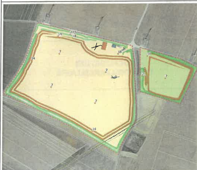
PHASE 6 (25-30 ans) : 2039 - 2043