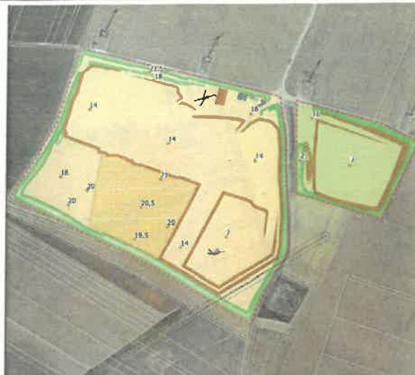
PHASE 3 (10-15 ans) : 2024 - 2028